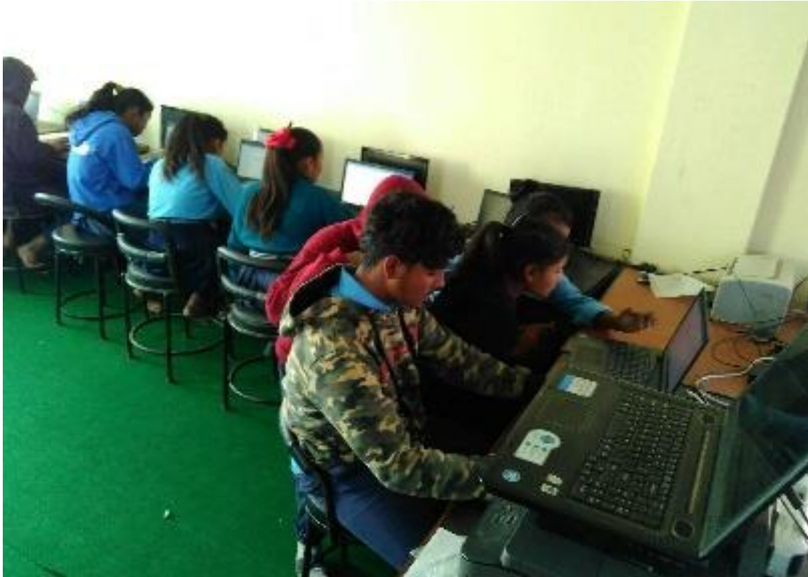
Er wordt gretig gebruik gemaakt van de nieuwe laptops voor de Thalibary Secondary School in Pandrung